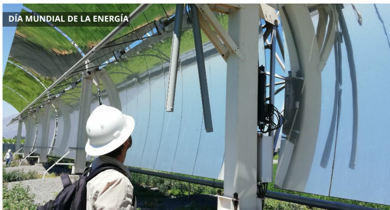
DÍA MUNDIAL DE LA ENERGÍA

El calor del Sol puede brindar más que agua caliente residencial. A través de procesos que involucran el uso de agua, aceite o sales, se está convirtiendo en una fuente de energía limpia y eficiente para aplicaciones industriales, militares y experimentales. El 14 de febrero, Día Mundial de la Energía, es una oportunidad para abordar esta aplicación de la energía renovable en la que trabajan investigadores de Fraunhofer Chile.