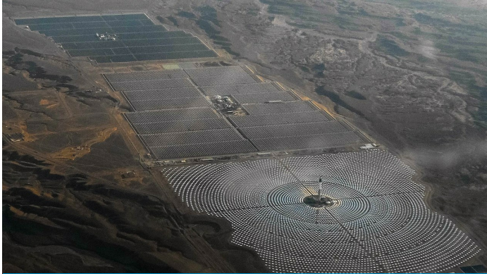
Complejo Noor de la empresa Sener en Marruecos.